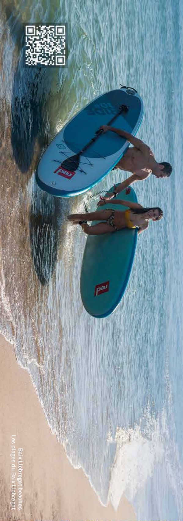
Baix Llobregat beaches Les plages du Baix Llobregat