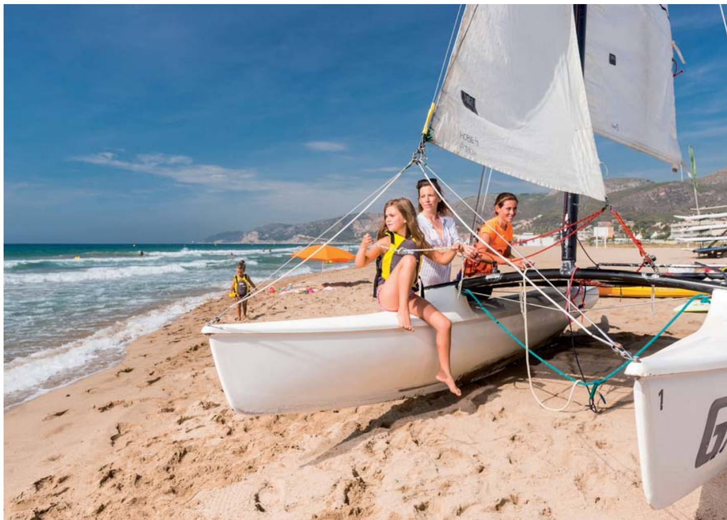
TURISME BAK LLOBREGAT