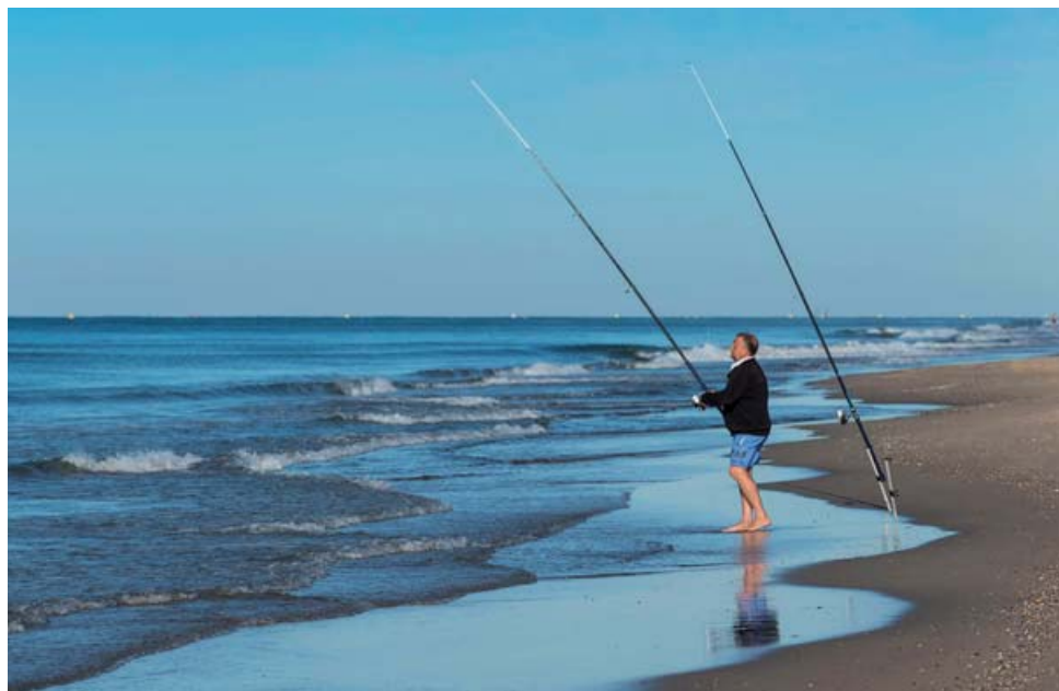
TURISME BAIX LLOBREGAT